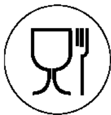
Рисунок 1 для пищевой продукции