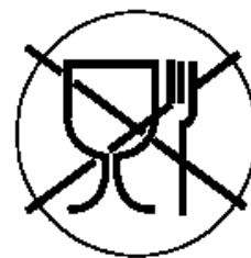
Рисунок 3 для непищевой продукции