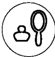
Рисунок 2 для парфюмерно- косметической продукции